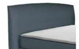
0815 Höhe 118 cm