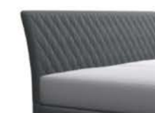
0752 Höhe 117 cm