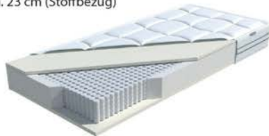
MA 425: Periletto 1000 / MS 428