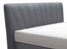
0413 Höhe 127 cm