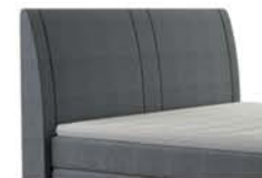
0050 Höhe 117 cm