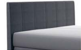
0320 Höhe 115 cm