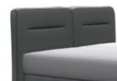
0728 Höhe 119 cm