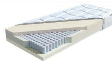
MA 355: Periletto TFK / MS 358