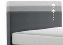
0300 Multimaß Höhe 55 - 125 cm in 5cm-Schritten kürzbar